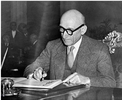
Ο Υπουργός Εξωτερικών της Γαλλίας Ρ. Σουμάν

Η 9 η Μαΐου κάθε χρόνο καθιερώθηκε ως ημέρα της Ευρώπης. Αυτή τη μέρα γιορτάζουμε την ενότητα και την ειρήνη στην Ευρώπη. Η επιλογή της ημέρας αυτής δεν είναι καθόλου τυχαία. Τέτοια ημέρα (9 Μαΐου) του 1950 ο Ρομπέρ Σουμάν, υπουργός εξωτερικών της Γαλλίας, διατύπωσε την πρόταση του για συνεργασία των χωρών της Ευρώπης, ειρήνη και συμφιλίωση με σκοπό την ανάπτυξη όλων των λαών της Ευρώπης.